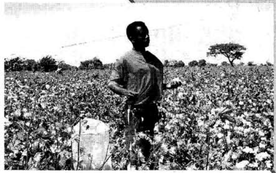
手摘み綿花にこだわる大正紡績のオーガニックコットン

ブームが続くオーガニックコットンだが、その代名詞的存在が大正紡績である。早くからオーガニックコットンを中心とし、環境に優しく、人を幸せにするモノ作りを進めてきた同社。今年には「毎日ファッショングッド」を受賞し、その知名度はコンシューマー